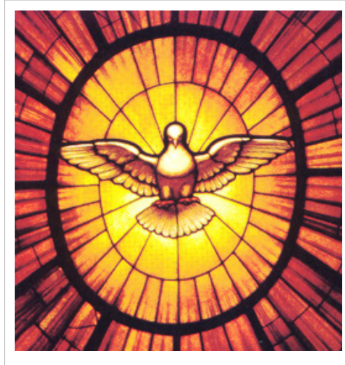
Colomba dello Spirito Santo